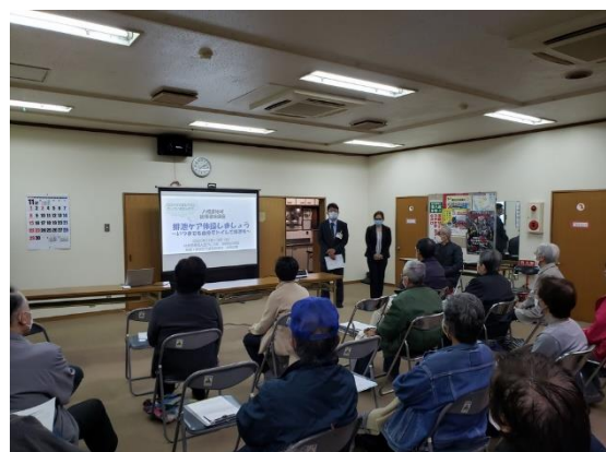
受託者:社会医療法人 きつこう会