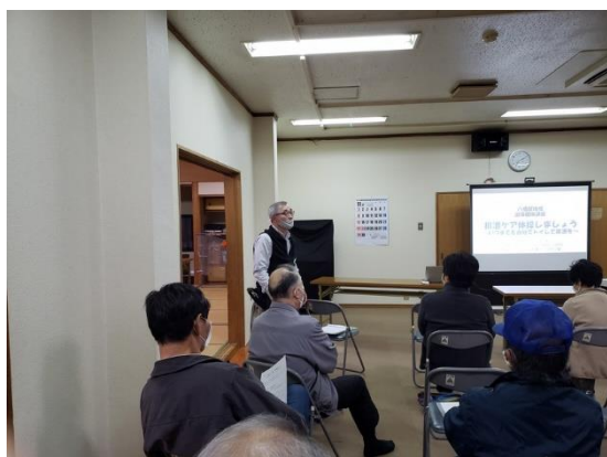
協力:八幡屋地域活動協議会