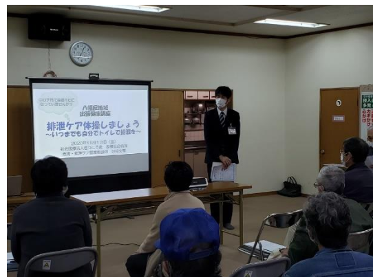
主催:大阪市港区役所 協働まちづくり