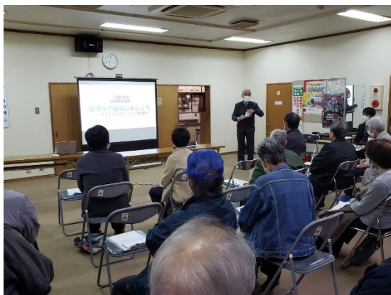
受託者:NPO 法人 南市岡地活協